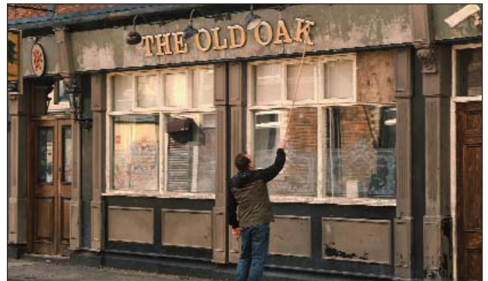
The Old Oak de Ken Loach

PRIX DE LA PLACE : 7,50 € OU 5,50 € PAR 10 PLACES (55 €) 4,50 € POUR LES MOINS DE 18 ANS