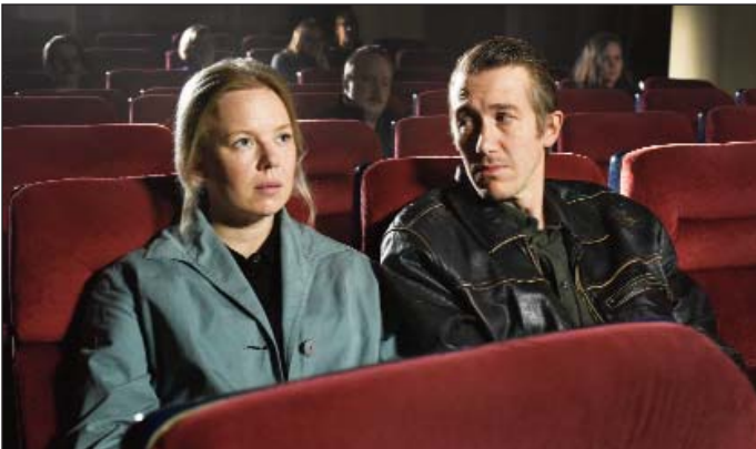
Les Feuilles mortes d'Aki Kaurismäki

fêtons la rentrée et les 30 ans de Pandora avec 4 avant-premières