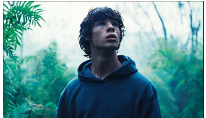
Le Règne animal de Thomas Cailley